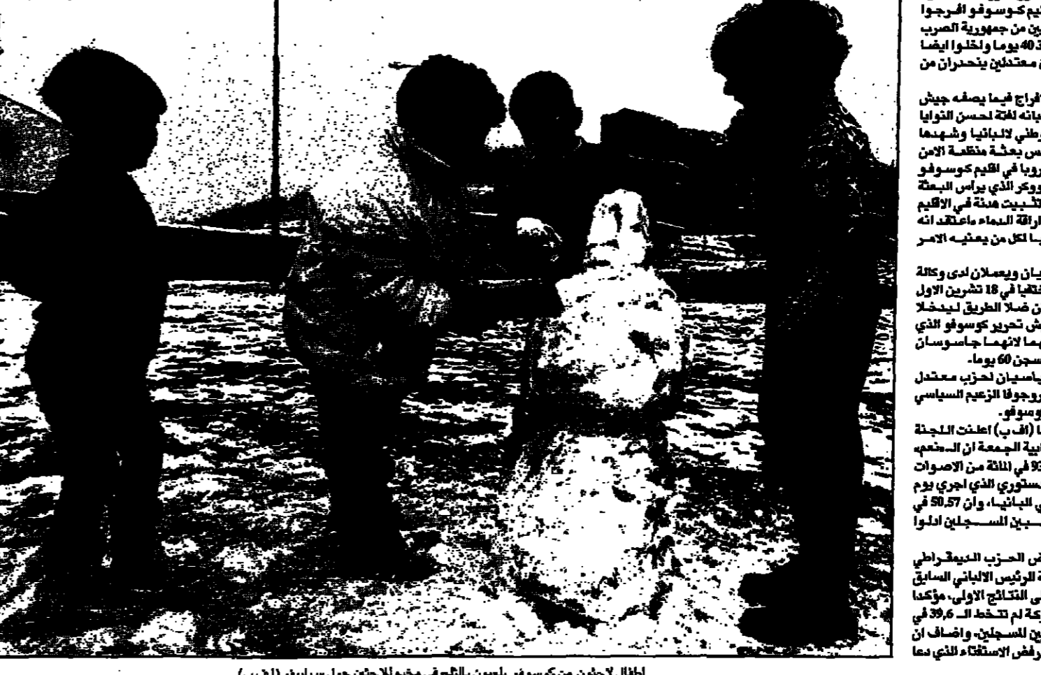
اطفال لاجئون من كوسوفو يلمون بالبحر في مخيم للاجئين حول سراييفو (ا ف ب)

■ برايوچي - رويترز - قال شهود عيان ان نوار كوسوفو وكوسوفو افروجا الجمعة من صحين من جمهورية الصرب كانا اختطفا منذ 40 يوما واخوانا ايضا سويل سياسيين مستقلين يتحذرون من اصل الياباني. لكن عملية الافراج فيما وصفه جيش تحرير كوسوفو بانه اقل من نصف القوات عدية الكوسوفو الوطني لاجانبا وشعبها وقيام وكر رئيس وحدة مختصة الامن والتمارين في اوروبا في اقليم كوسوفو والشرب. وقال وكر الذي يرأس البعثة التي تسعى الى توحيد هذه في الاقليم الذي تعصف به اربعة السداه ماعتقد انه كان يوما طيبا لكل من يعبه الامر وكوسوفو. وكان الصحفيان ويصمان ادى وكالة اتناوخ للاخبار اخفيا في 18 تشرين الاول (أكتوبر) بعد ان ضل الطريق ليخجل منطقة تابعة لجيش تحرير كوسوفو الذي امن ان له اعترافا لانهما جاسوسان وحكم عليهما بالسجن 60 يوما. ويتمتع السياسيان بحزب معتدل يتزعمه البراهيم روجوفو الزعيم السياسي البارز في اقليم كوسوفو. وفي جنرالنا (ا ف ب) اعطت اللجنة المركزية الانتخابية للجمعة ان السخيم حصلت على 93.5 في المائة من الاصوات في الاستفتاء السنوي الذي اجري يوم الاحد الماضي في اليابان، وان 89.7 في المائة من الناخبين السنخيل انلوا باصواتهم. وقد اعترض الحزب الديمقراطي المعارض بزعامة الرئيس الياباني السابق صاحب بريشا على النتائج الاولى، مؤكدا ان نسبة للتصاريح لم تتخط ال 96.6 في المائة من الناخبين السنخيل، واضاف ان الشعب الياباني رفض الاستفتاء الذي دعا الى مقاطعته.